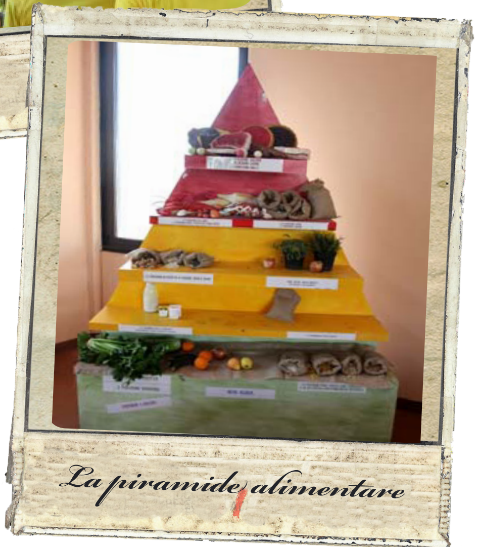
La piramide alimentare