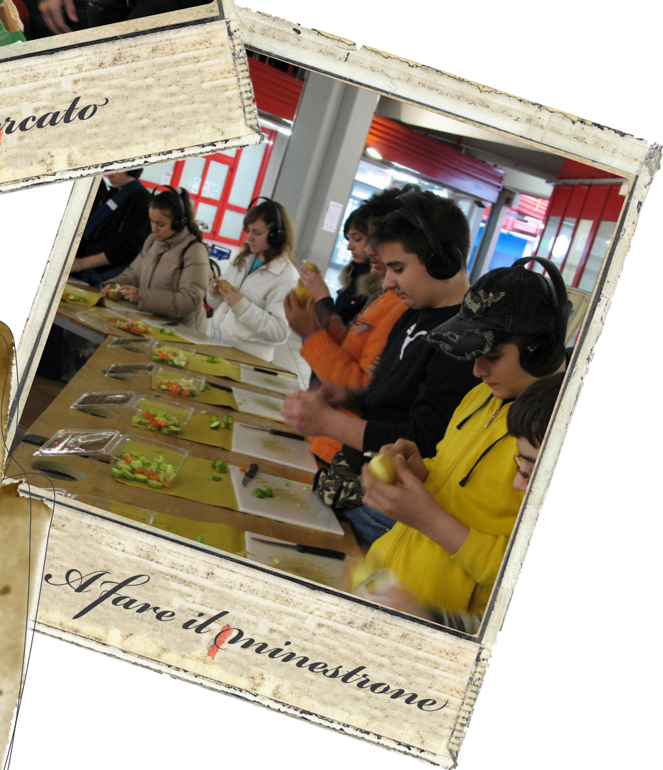
A fare il minestrone