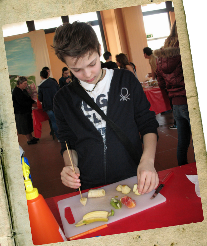
Lo spiedino di frutta ...