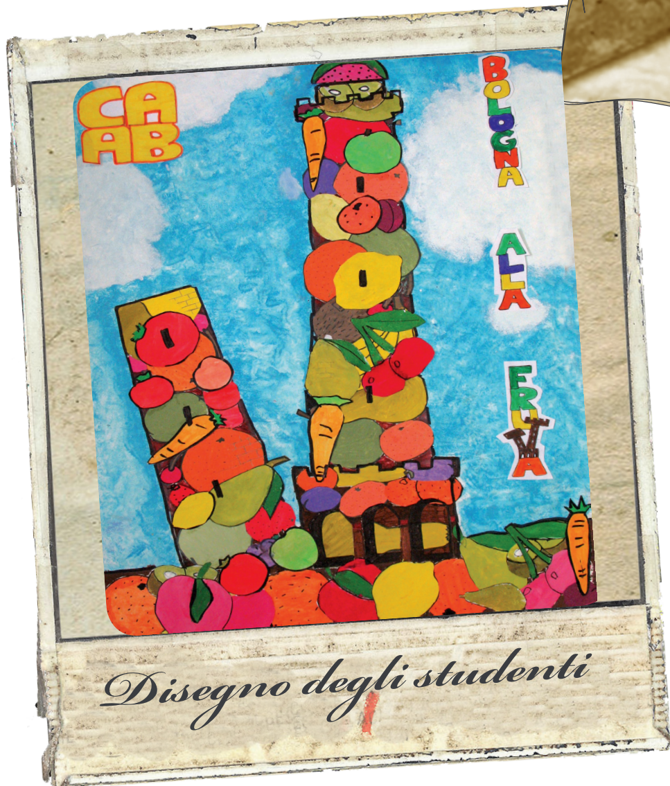
Disegno degli studenti