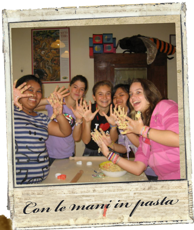
Con le mani in pasta