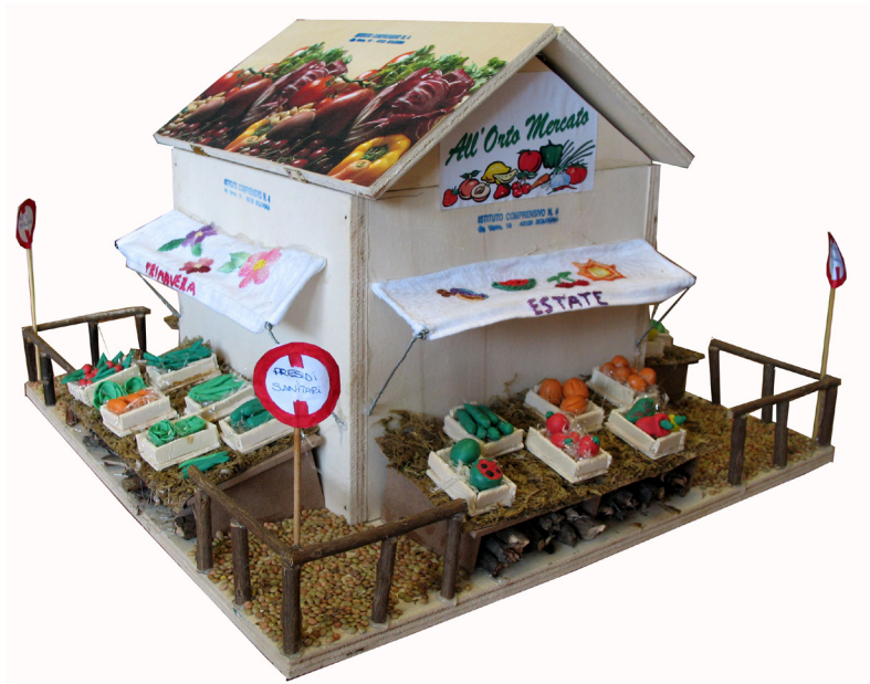
Il mercato visto dagli studenti