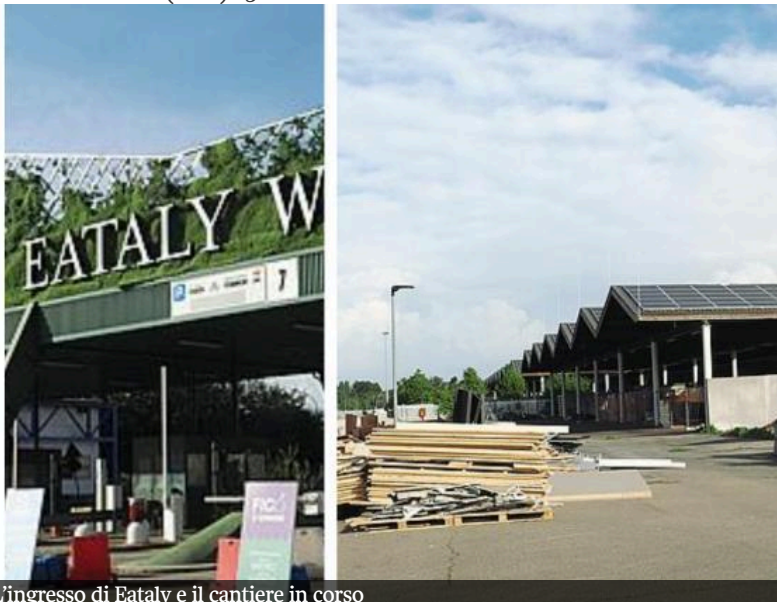
L'ingresso di Eataly e il cantiere in corso