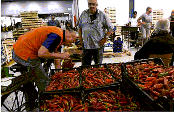
Il lavoro notturno all'interno del Caab, il grande centro agroalimentare