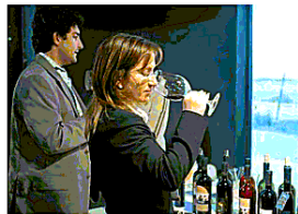
In piazza Minghetti la "Wine Week"