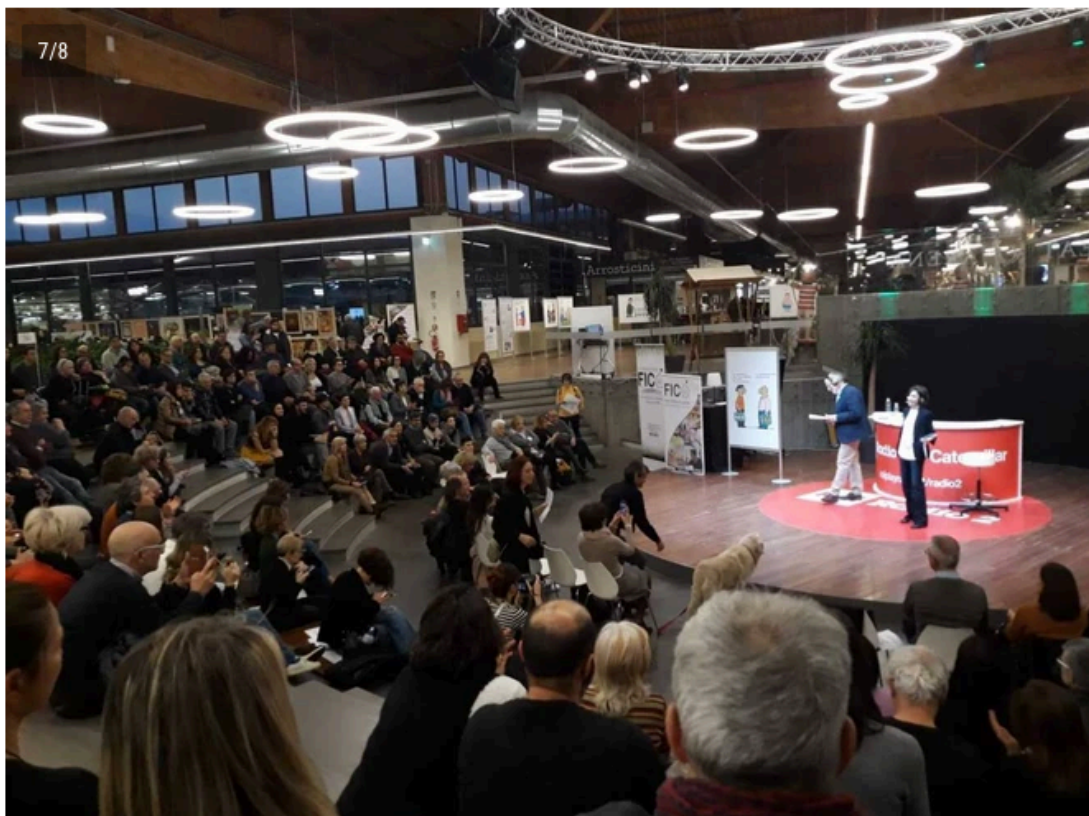
Tutto esaurito nell'Arena di Fico Eatalyworld