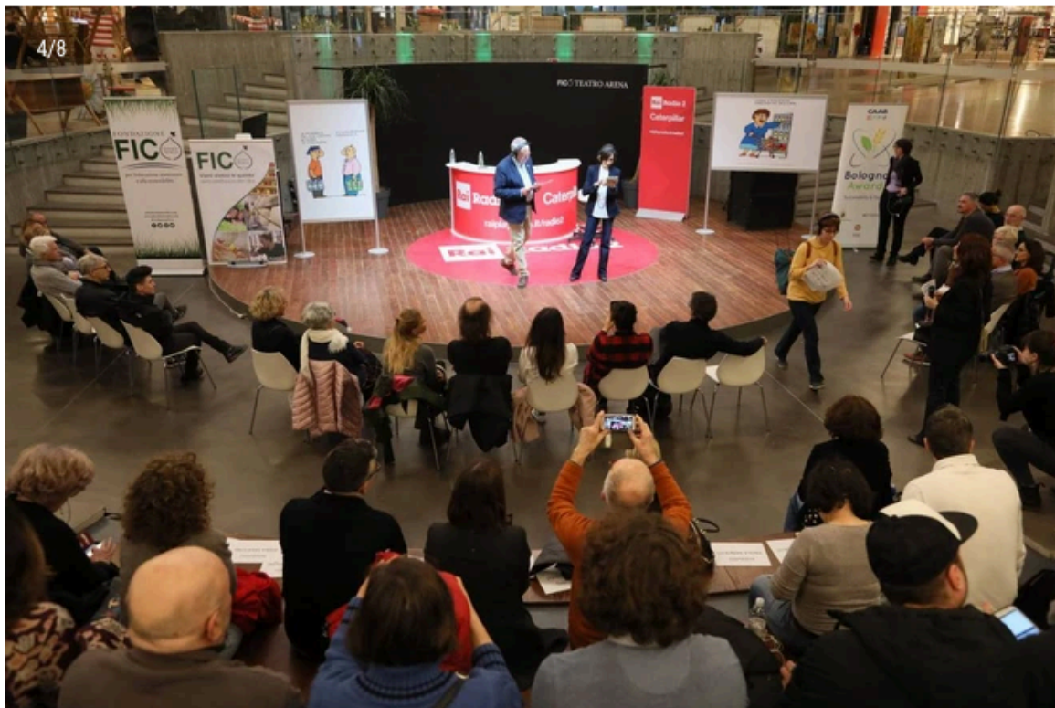
Bologna è la prima città che ospita il live di Caterpillar per M'illumino di meno