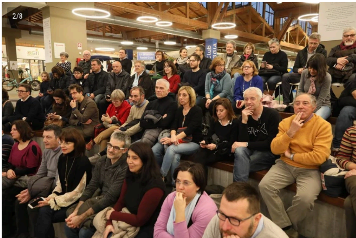
Tutto esaurito nell'Arena di Fico Eatlyworld