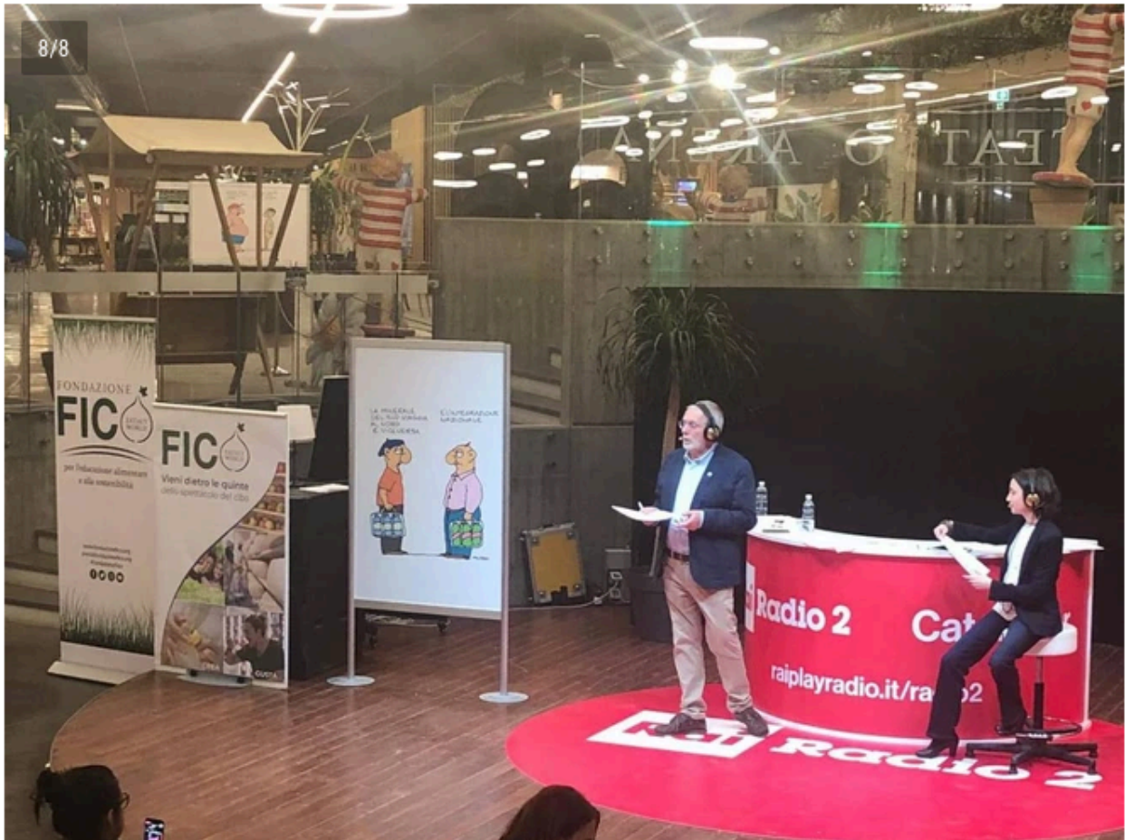
Per la prima volta in trasferta fuori da Milano, dove hanno sede gli studi Rai che trasmettono Caterpillar