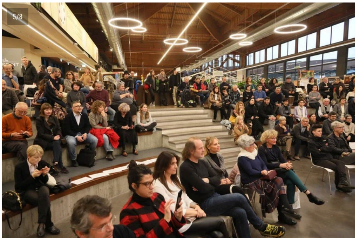
M'illumino di meno è la Giornata del Risparmio energetico e degli stili di vita sostenibili