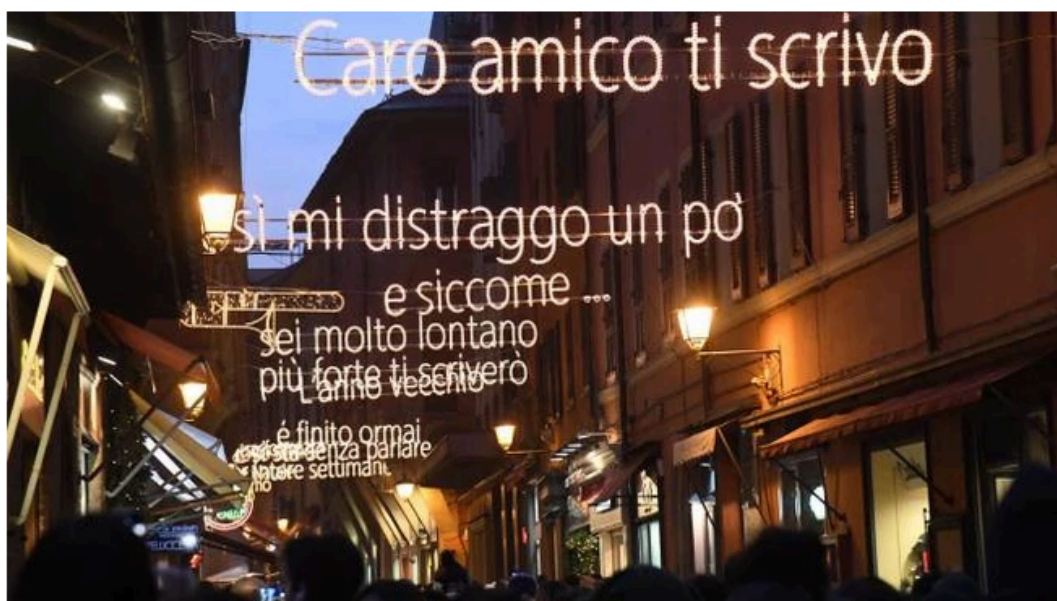
Saranno spente anche le luminarie-tributo a Lucio Dalla

Ultimo aggiornamento il 1 marzo 2019 alle 19:45