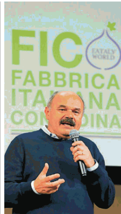
Il patron di Fico Oscar Farinetti

«Siamo troppo sbilanciati verso il fine settimana. Dobbiamo riequilibrare gli accessi favorendo la frequentazione nei feriali, anche perché, il sabato e la domenica, può succedere che ventimila persone non ce la facciano a mangiare malgrado i 47 ristoranti e gli ottomila coperti. Inoltre dobbiamo essere più attrattivi in estate, stagione che