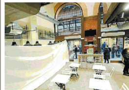
La Centrale del gusto Granarolo lascia il Mercato di mezzo