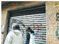
Saracinesche abbassate Nel 2018 duecento negozi in meno