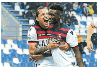
MONARI, pagina XI

Inzaghi sfida l'Atalanta "Sogno più che una salvezza"