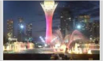
MISSIONE IN KAZAKHSTAN (5-11 GIUGNO 2016)