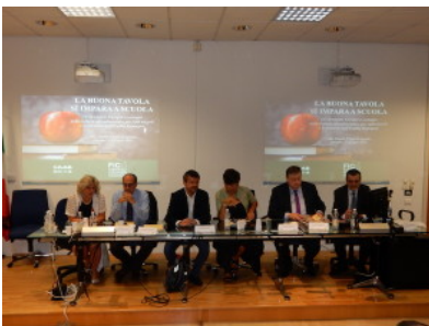
Lunedì approfondimento sulla giornata dedicata ai nuovi progetti nel centro agroalimentare di Bologna