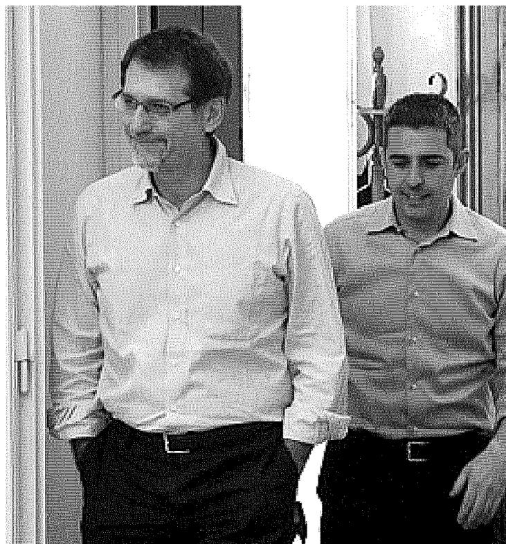
Insieme Il sindaco Virginio Merola e Federico Pizzarotti dopo la sua elezione nel 2012