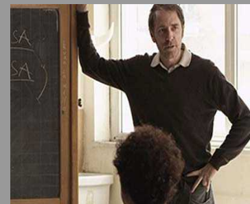
Editoria/ L'attore Valerio Mastandrea nuovo socio di Isbn...