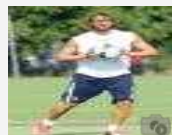
Il Bologna sui social network