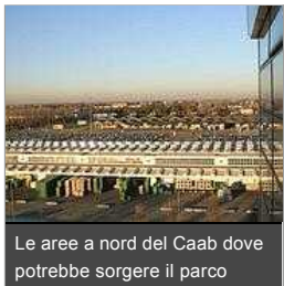
Le aree a nord del Caab dove potrebbe sorgere il parco