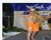
Ecco il babbo più bello d'Italia