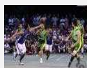
Trionfo di VMagazine-Formosa al Playground