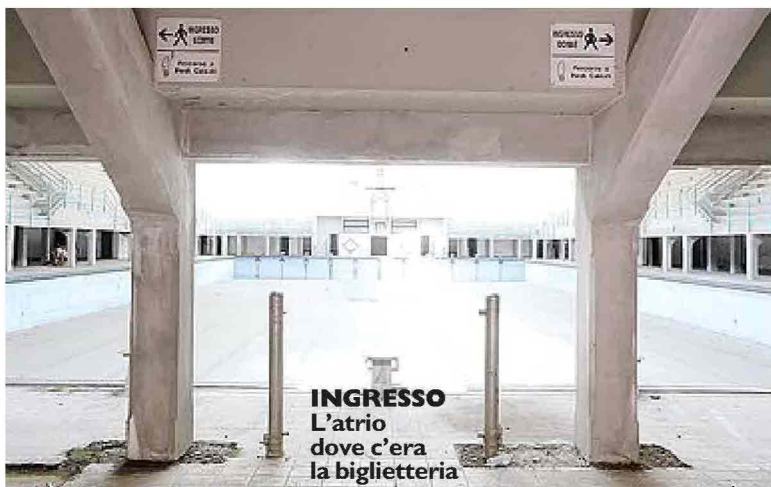
INGRESSO L'atrio dove c'era la biglietteria