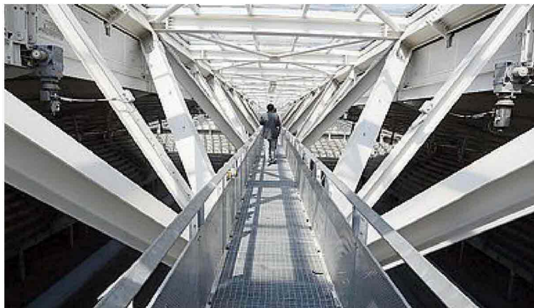
DALL'ALTO La passerella al di sotto della copertura mobile