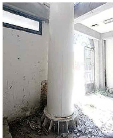
Uno dei pilastri portanti