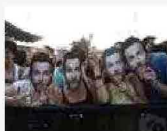
Jovanotti, Dall'Ara in delirio