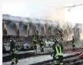
A fuoco tre vagoni allo scalo San Donato