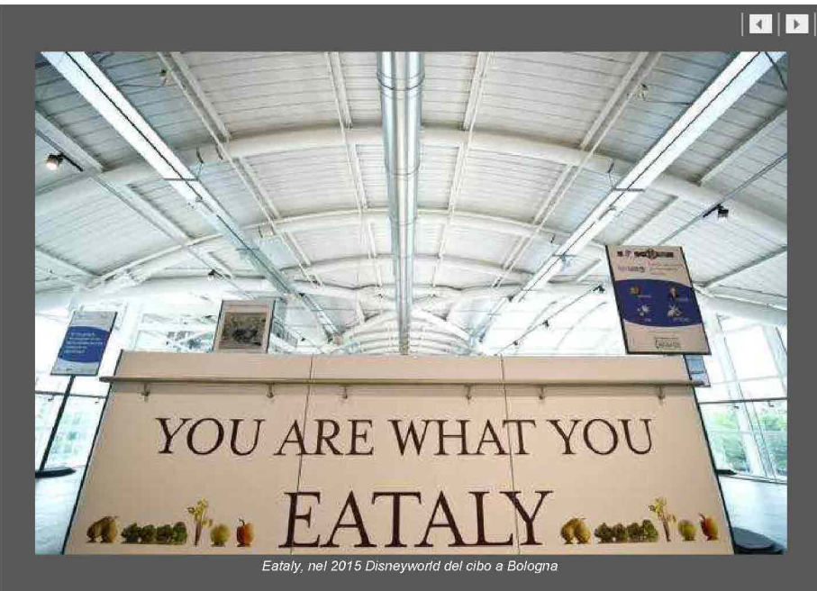
Eataly, nel 2015 Disneyworld del cibo a Bologna

Indietro Stampa Invia Scrivi alla redazione Suggestisci