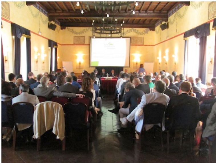
Un momento del convegno di Italia Ortofrutta