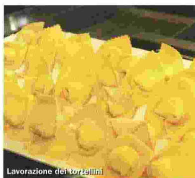
Lavorazione dei tortellini