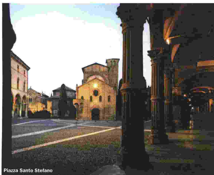
Piazza Santo Stefano

Una storia emiliana, di quelle autentiche e distintive per spirito d'iniziativa e creatività, che hanno reso la gastronomia un elemento caratterizzante del made in Italy nel mondo”.