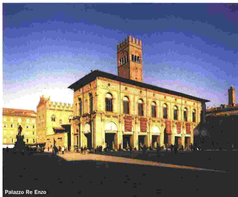
Palazzo Re Enzo

Tutti i partner pubblici e privati che aderiranno all'iniziativa concorreranno alla promozione a livello internazionale di Bologna come città del cibo. A loro e al resto della comunità urbana si propongono di adottare il brand "City of Food is Bologna" e di lavorare insieme attorno ai seguenti temi: Cultura e Ricerca Filiera agro-alimentare e Sostenibilità ambientale; Tutela della biodiversità e del suolo agricolo; Scienza, formazione ed educazione sull'alimentazione per i giovani; Riqualficazione dei mercati citta-