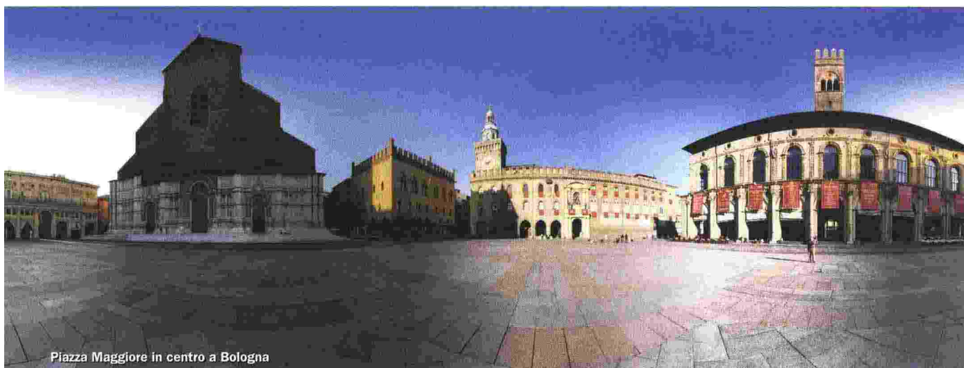
Piazza Maggiore in centro a Bologna

ni e delle eccellenze bolognesi su scala metropolitana.